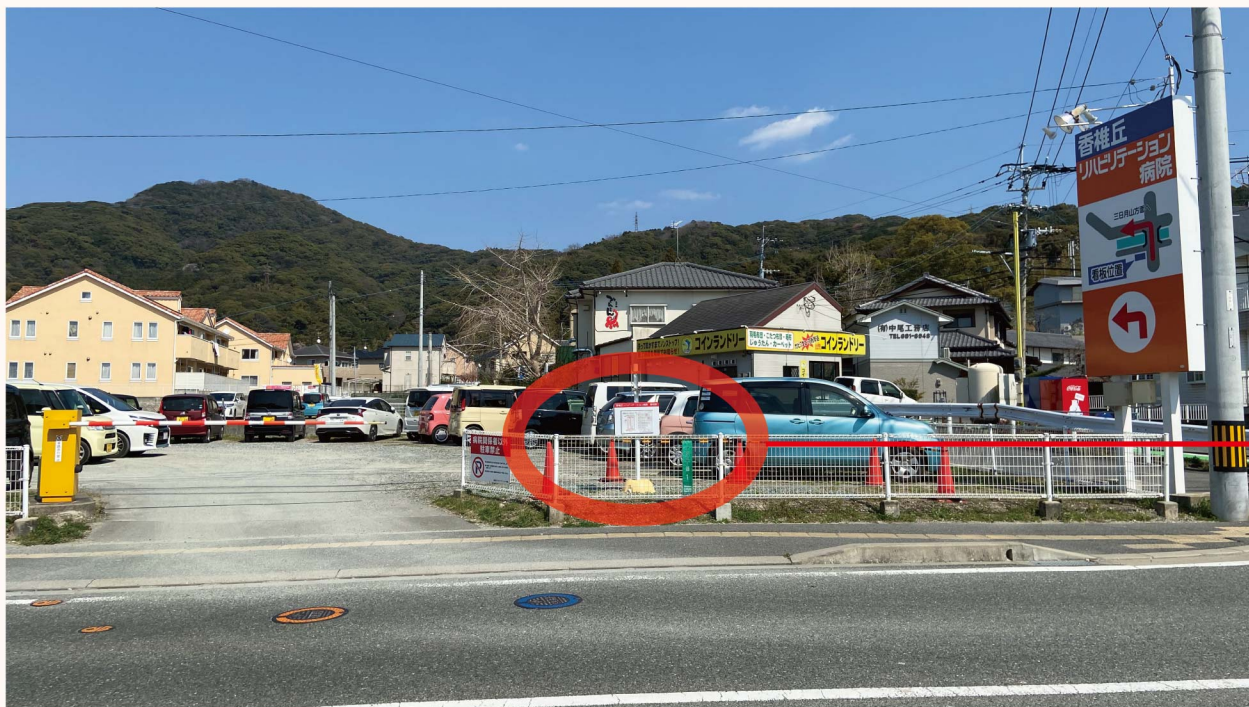
■下原駐車場入口そば